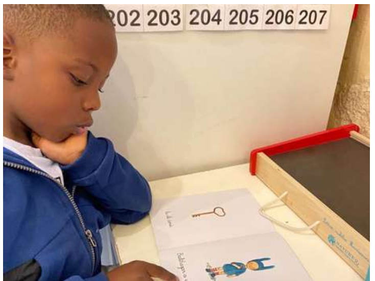
Bref, vous avez compris...