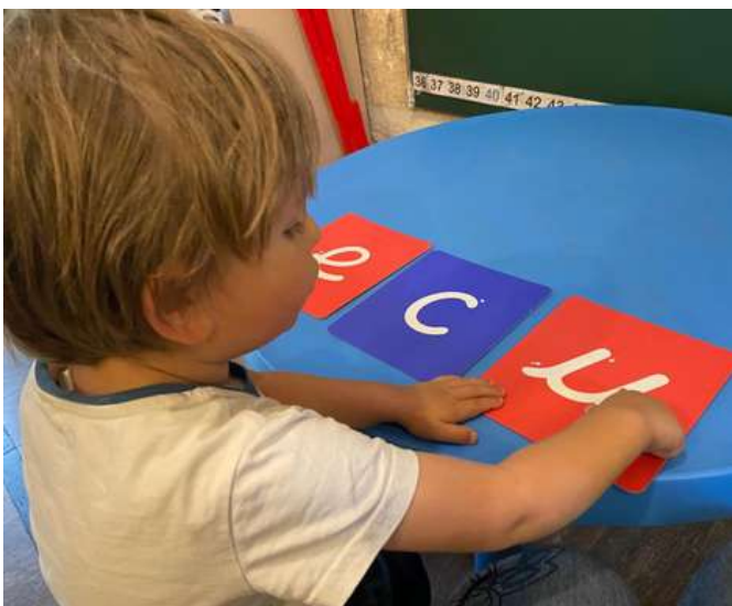
Ici on trace (patiemment) les lettres...