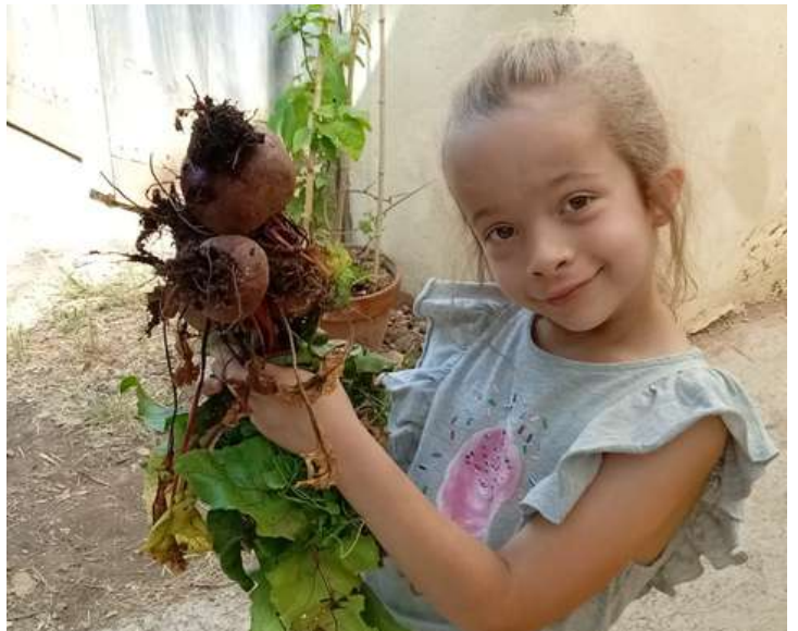
Là on a cueilli (patiemment) des betteraves...