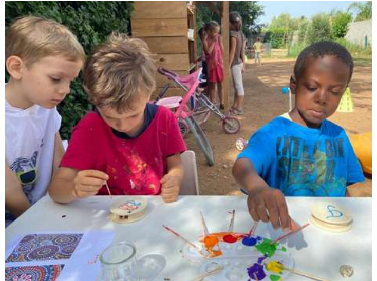
Là, la fête des pères...