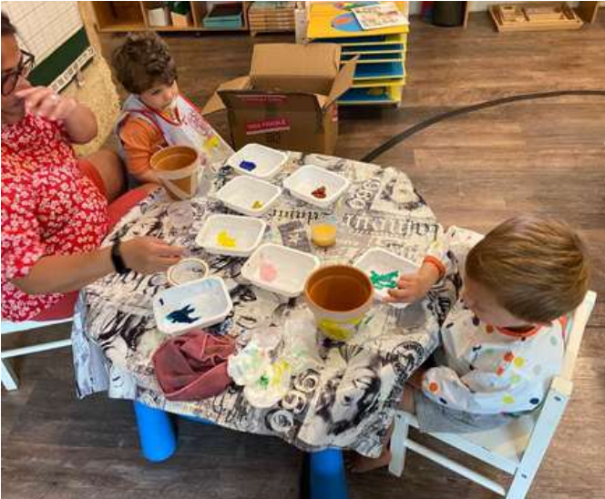
Ici, on prépare (patiemment) la fête des mères...